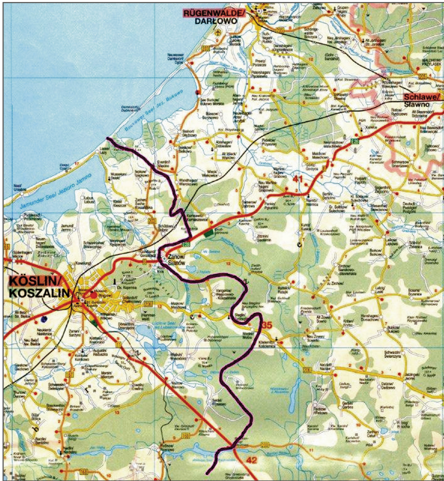
Granica między dawnymi powiatami koszalińskim i sławieńskim około 1912 roku