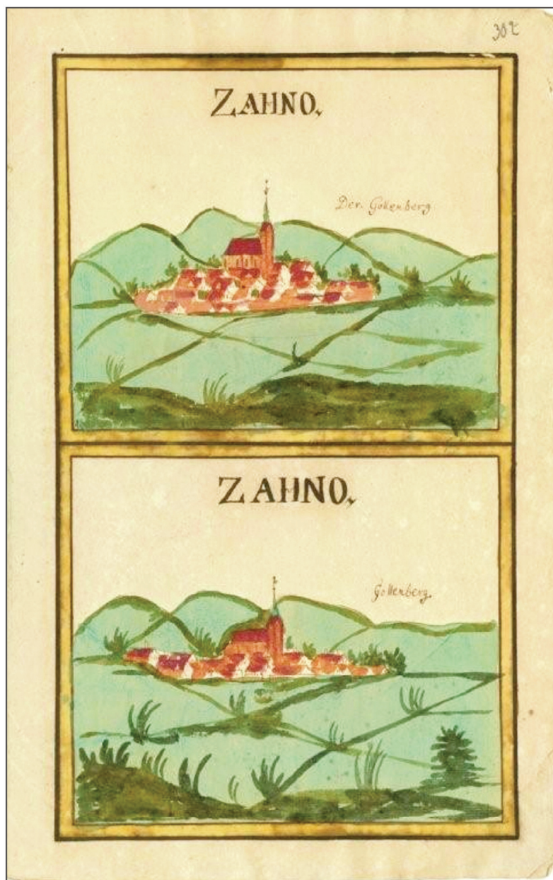
Widok Sianowa z drugiej połowy XVII wieku według Pristaffa