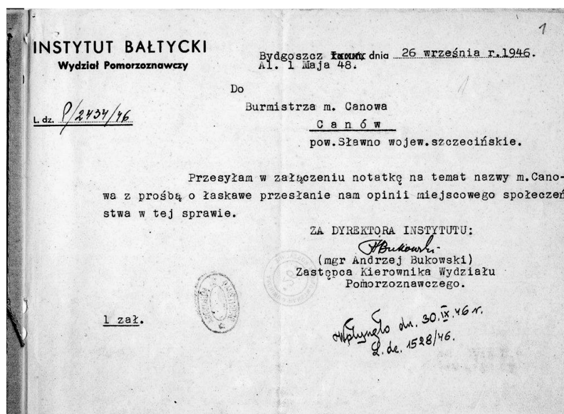
Ryc. 1. Korespondencja w sprawie zmiany nazwy miejscowej Canów na Sianów (Akta Zarządu Miejskiego i Miejskiej Rady Narodowej w Sianowie, Archiwum Państwowe w Koszalinie, nr zespołu 15, sygn. 12, s. 1)